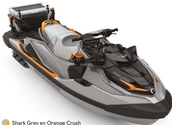
Shark Grey en Orange Crush