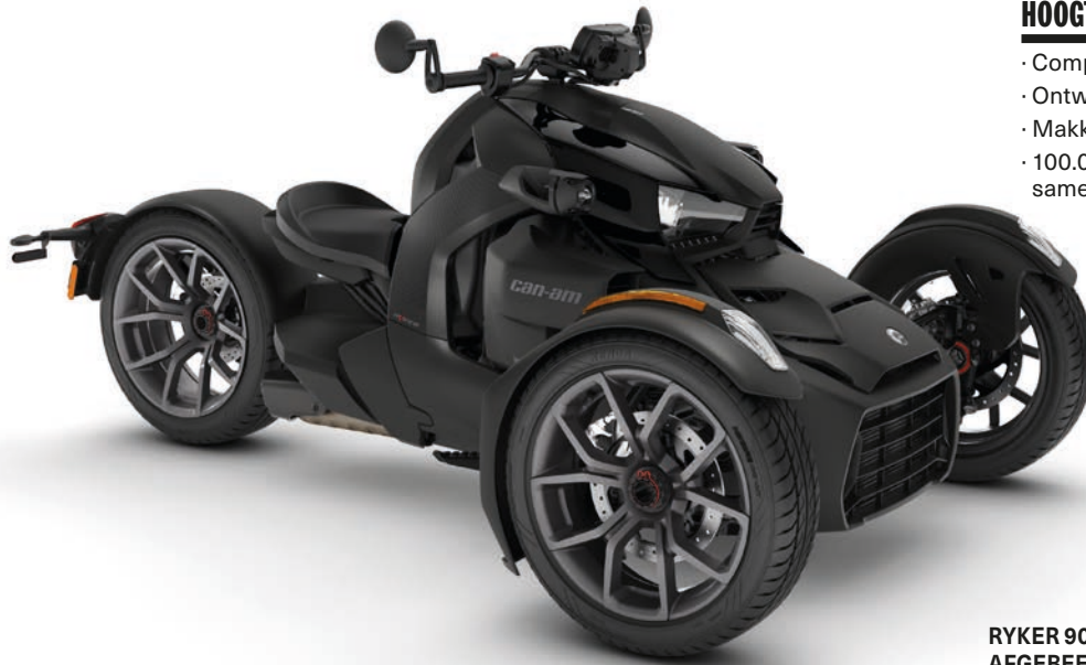
RYKER 900 AFGEBEELD MET PANELEN IN INTENSE BLACK