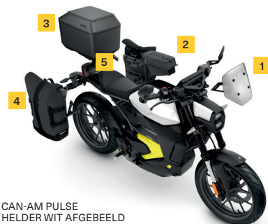
CAN-AM PULSE HELDER WIT AFGEBEELD